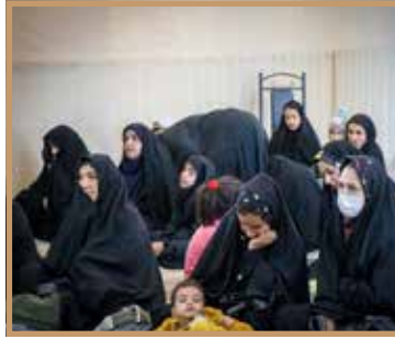
به همت مرکز مددکاری کوثر